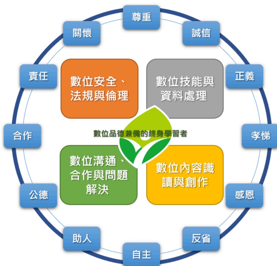
新北市數位品德教學指引概念架構圖

說明：以成為數位品德兼具的終身學習者為核心目標，如四肢發展般發展數位指引中所函示四項數位素養。輔以新北市十二項品德環繞，有圍有守地將應用數位於終身學習當中，成為優質的新北數位公民。